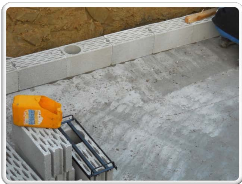
Elévation de la cave Réalisation en blocs de 20 MA