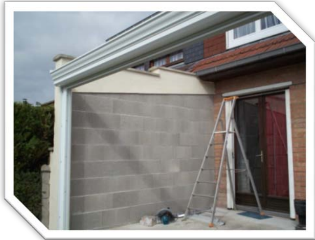
Véranda, Templeuve (59242), Réalisation en blocs de 20 MA