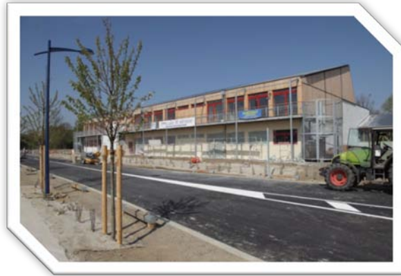
Bâtiment Regain du Siziaf, Douvrin/ Billy-Berclau (dept 62)

Constructeur : LB Construction M. FOUTREYN Rue Marceau 62790 Leforest Tél : 03.21.77.22.00 Lb-construction@wanadoo.fr